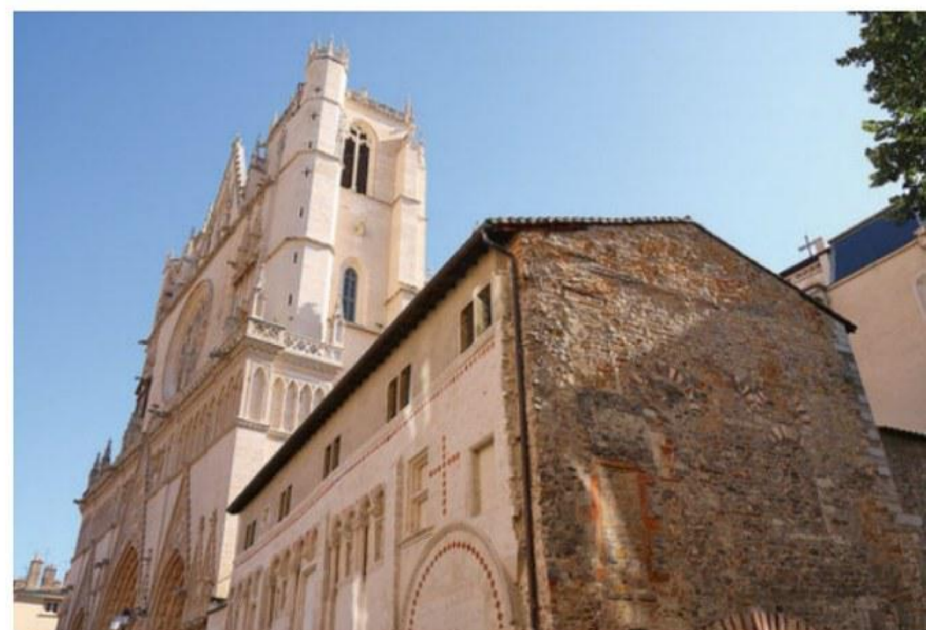
Dans le Vieux-Lyon, la cathédrale Saint-Jean-Baptiste trône fièrement sur la place Saint-Jean. À l'intérieur, vous pouvez admirer l'une des rares horloges astronomiques encore visibles.

A u confluent du Rhône et de la Saône, la troisième ville française en termes de population n'est pas seulement réputée pour son industrie. C'est aussi la capitale mondiale de la gastronomie. Dans le sillage de Paul Bocuse, la cuisine lyonnaise a su préserver sa réputation, notamment grâce aux bouchons. Ces restaurants typiques où l'on déguste les meilleures spécialités locales se concentrent essentiellement dans les ruelles du Vieux-Lyon, autour de la rue Saint-Jean et de la cathédrale Saint-Jean-Baptiste. On en trouve aussi dans le quartier de la presqu'île, le cœur de la cité qui s'étend autour de la place Bellecour, plus grande place piétonne d'Europe. Pour mieux découvrir la ville des Lumières, un petit détour par la colline de Fourvière s'impose. Depuis l'esplanade, à côté de la basilique Notre-Dame, une magnifique vue panoramique s'offre aux visiteurs. À deux pas, le théâtre antique fait également partie des incontournables.