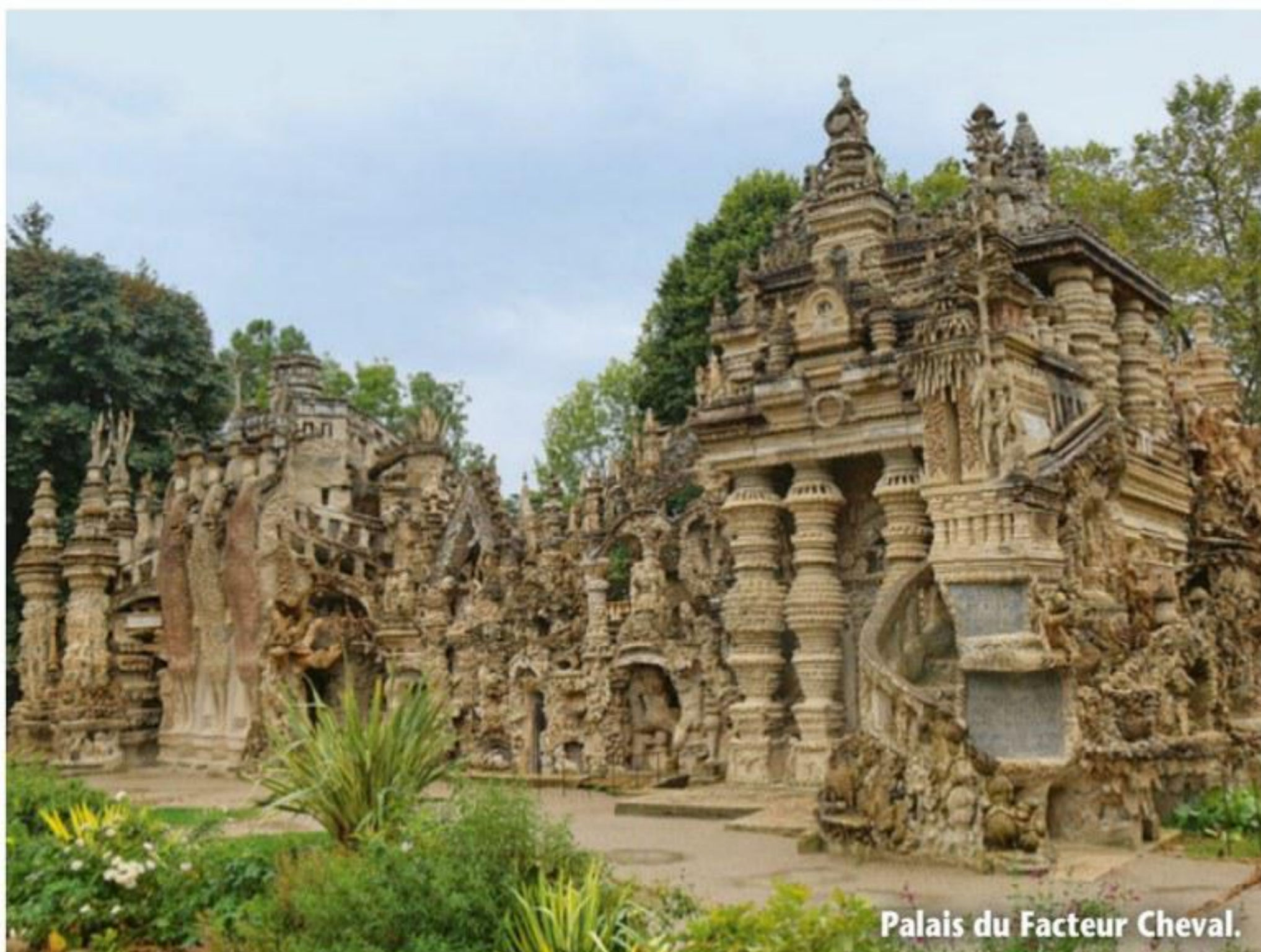
Palais du Facteur Cheval.