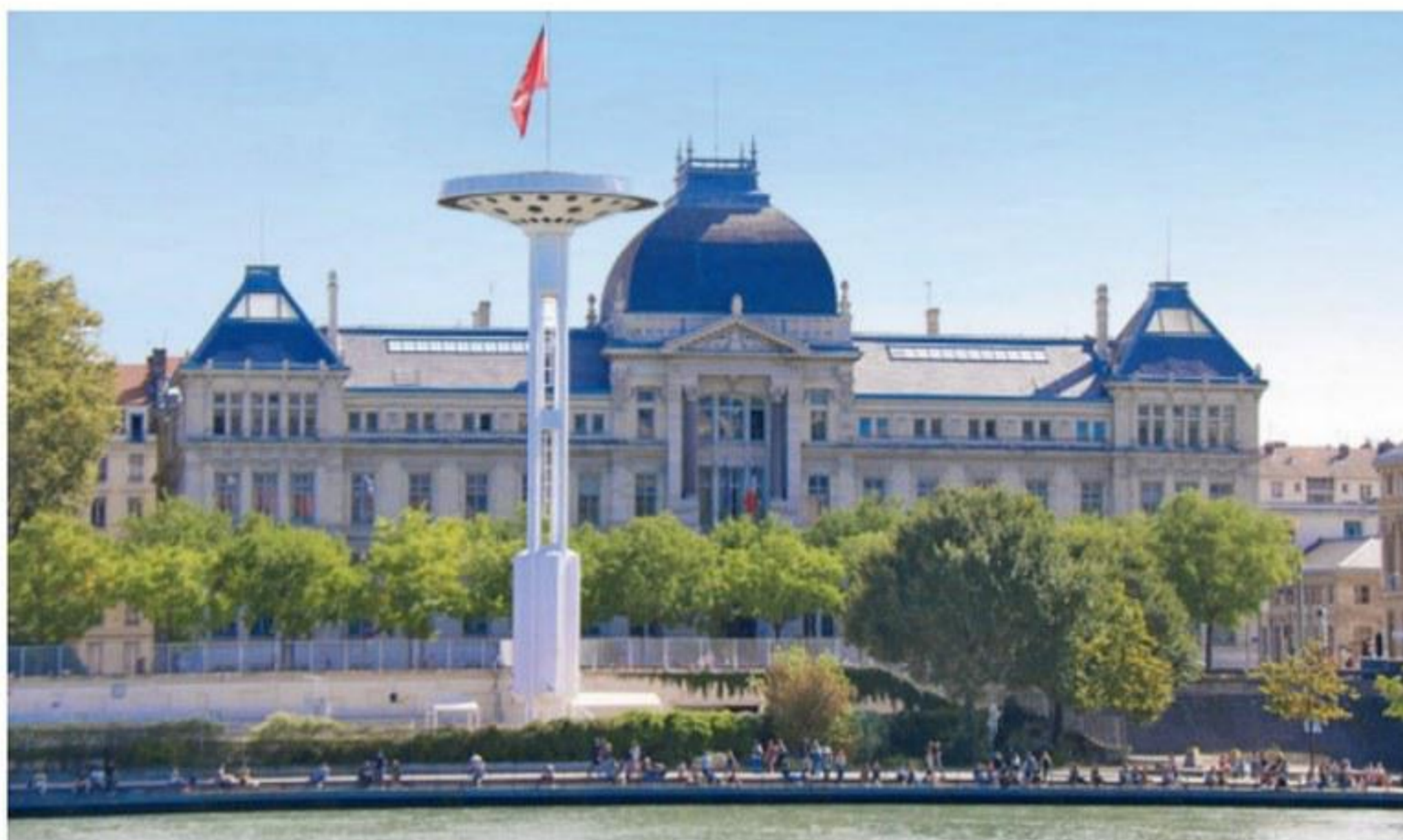
Les berges du Rhône sont très prisées des Lyonnais aux beaux jours. Piétons et cyclistes se partagent les quais, comme ici à proximité de l'université.