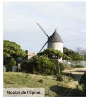
Moulin de l'Epine.

Au rythme des marées, par forts coefficients, les passionnés de pêche à pied envahissent le littoral. La partie la plus prisée est celle comprise entre le Gois et les parcs à huîtres de la zone Beauvoir-Noirmoutier. Le peuple des cirés jaunes, râteau en main, traque les proies enfouies dans le sable. On récupère alors quelques palourdes, coques et praires pour les déguster accompagnées d'un petit verre de muscadet et d'une tartine au beurre salé. Mais veillez à respecter les quantités autorisées et la maille (taille) des espèces récoltées : palourdes (3 kg et 4 cm), huîtres creuses (5 kg et 5 cm), coques (4 kg et 2,7 cm), moules (5 kg et 4 cm), bigorneaux (3 kg), crabes (13 cm pour les tourteaux et 6,5 cm pour l'étrille).