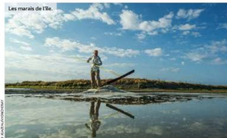
Les marais de l'île.

vers l'ouest et l'Océan, est balayée par le souffle d'Eole venant du large. L'île a compté jusqu'à 40 moulins à une certaine époque. Ils servaient à mouliner le blé produit sur place. Ceux qui restent font parti du patrimoine et sont entretenus par des particuliers. Parmi ceux dominant la dune de la Court, celui du Both semble veiller sur les bateaux amarrés. Nous sommes dans un espace préservé, où les grains de sable viennent caresser notre visage et troubler notre tranquillité.