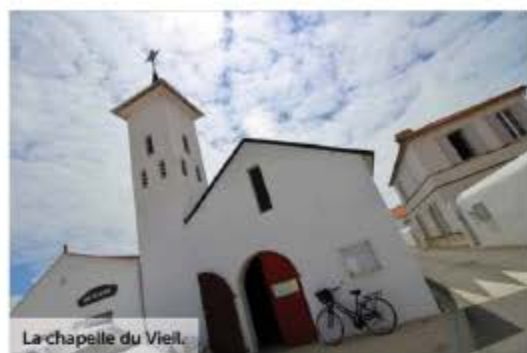
La chapelle du Vieil.