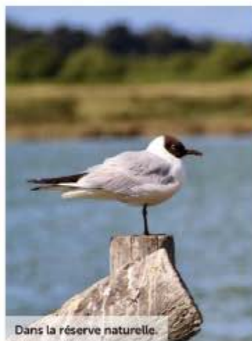
Dans la réserve naturelle.

de cœur pour un grand week-end voire une semaine. L'île est un véritable amplificateur de sensations de vacances.