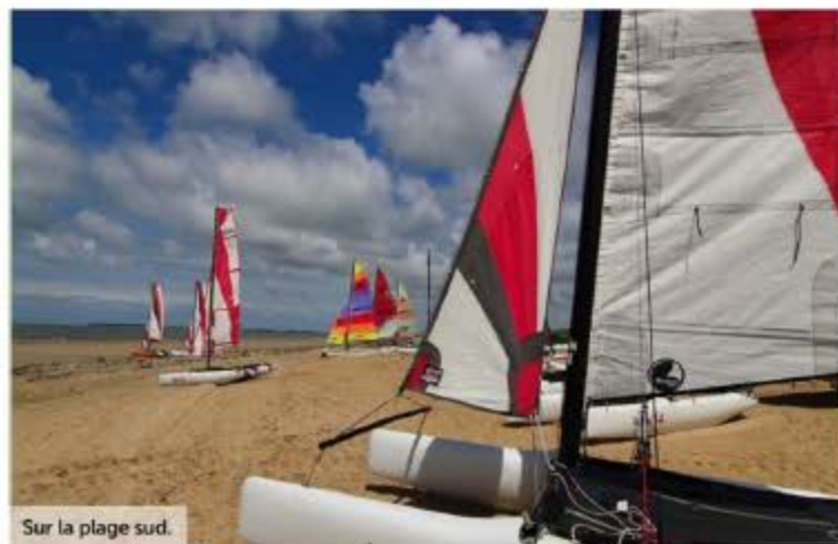
Sur la plage sud.

A la pointe nord-ouest de l'île, la plage de la Linière est l'une des plus fréquentées. Celles du Viel, de la Clère, et surtout la célèbre plage des Dames accessible par le bois de Chaise, complètent le panel au nord. La plage des Sableaux, la plus proche de Noirmoutier-en-Île, est aussi très courue. Celles moins fréquentées se trouvent sur la façade ouest et de façon quasi continue, de la plage des Lutins, au sud de L'Herbaudière, les Boucholeurs, vers la pointe sud. Au sud de L'Épine, la plage des Eloux, derrière le bois, et celle de la Court offrent des espaces plus ventés qu'au nord, mais ô combien authentiques.