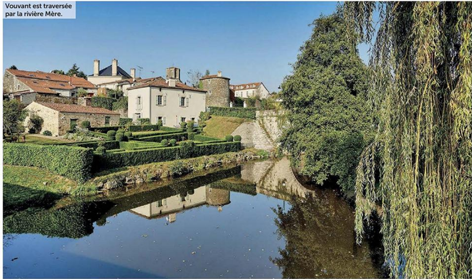
Vouvant est traversée par la rivière Mère.

Le bocage un tantinet secret du Pays de la Châtaigneraie est la destination idéale, en Vendée, pour réaliser une pause en mode randonnées, détente et visites! La commune de La Châtaigneraie, au centre de ce territoire verdoyant et vallonné de 320 km 2 , est un bon point de départ. Avec un passage obligé à l'Office de Tourisme, le seul de ce petit pays! Commençons par explorer l'ouest du territoire. Arrêtons-nous, par exemple, aux carrières de Cheffois. Cet ancien oppidum gaulois, devenu lieu d'extraction de quartzite, forme aujourd'hui un vaste