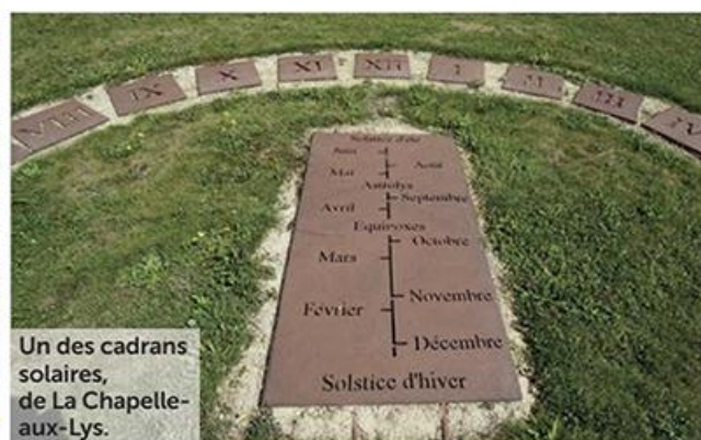
Un des cadrans solaires, de La Chapelle-aux-Lys.

Repasant à la Châtaigneraie, vous mettez cette fois cap à l'est, pour atteindre La-Chapelle-aux-Lys, un village tout entier tourné vers le cosmos. Laissez-vous surprendre par cette "petite cité des