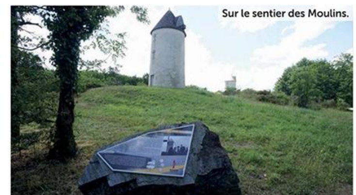
Sur le sentier des Moulins.