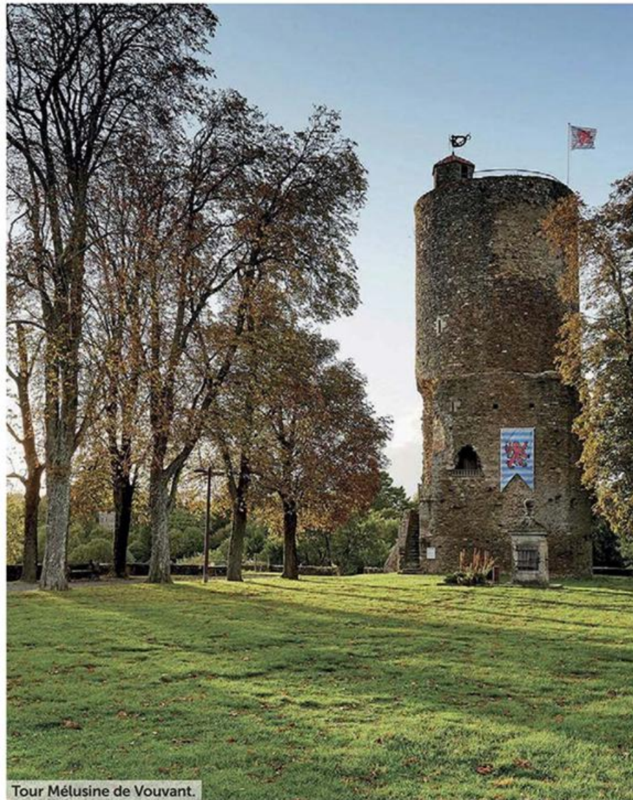
Tour Mélusine de Vouvant.

étoiles" dotée d'un planétarium. La mairie évolue sur le même registre, avec son jardin des Cadran solaire et son étonnante ligne méridienne. Si vous souhaitez approfondir votre connaissance de l'histoire de l'univers et du système solaire tout en randonnée, on vous suggère d'emprunter le Chemin aux Étoiles, au départ du bourg.