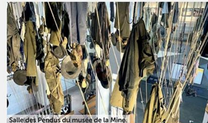
Salle des Pendus du musée de la Mine.