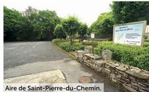
Aire de Saint-Pierre-du-Chemin.

Tables de pique-nique et étang à proximité immédiate. Rue Pierre-Bressuire. GPS: (N) 46°41'50"/(O) 0°41'53".