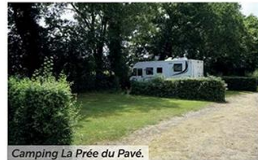
Camping La Prée du Pavé.

plein d'eau, vidange, électricité et Wi-fi). Rue du Pavé. GPS: (N) 46°40'16"/(O) 0°50'41".