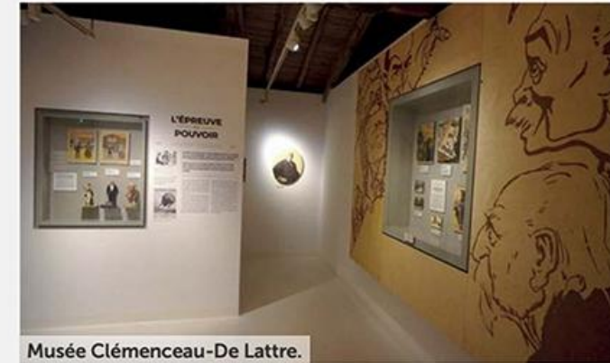
Musée Clémenceau-De Lattre.

Info: 02.51.00.31.49, musee-clemenceau-delattre.fr