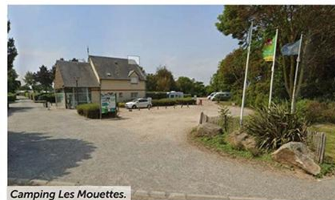
Camping Les Mouettes.

Le camping Les Mouettes *** est la solution pour une étape nocturne à Veules-les-Roses. L'établissement propose une aire d'une dizaine de places à l'entrée du camping avec