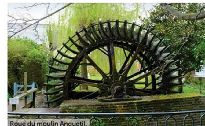
Roue du moulin Anquetil.