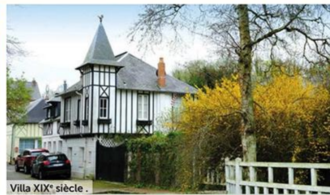
Villa XIX e siècle.