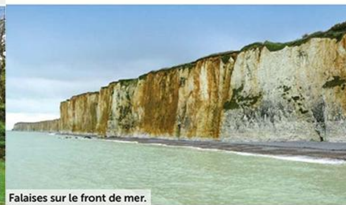
Falaises sur le front de mer.