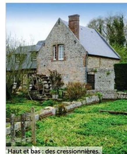
Haut et bas : des cressionnières.

rustique et artisanale, ne manquent pas d'atouts pour autant, notamment avec leurs fabuleux toits en roseau ou en seigle, où les iris et les jubarbes témoignent d'un savoir-faire précis et méthodique, en plus d'être ancestral. Alors que la polychromie des pierres, avec du silex, des briques et du grès, fait toujours son petit effet. Beauté absolue !