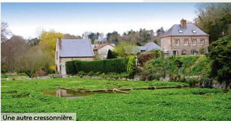
Une autre cressonnière.

• aire d'accueil (20 places, 8 €) + services. Ouverte toute l'année. Chemin des Courses. GPS : (N) 49°51'8"/(E) 0°36'5". • aire d'accueil (60 places, 8 €) + services (eau coupée en hiver). Ouverte toute l'année. Digue Jean-Coruble, parking de la Plage. GPS : (N) 49°51'14"/(E) 0°36'16".