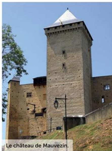
Le château de Mauvezin.

A l'entrée de La Barthe-de-Neste, non loin de l'Office de Tourisme, le boulodrome propose un parcours santé au sein d'un parc arboré, avec halte pique-nique ombragée. Outre un marché dominical très attrayant, ce village retiendra les gourmands avec son artisan chocolatier confiseur très réputé, Les flocons pyrénéens. Toujours dans la vallée de la Neste, limitrophe à La Barthe –au premier croisement si vous reprenez la route départementale 938–, se trouve Montoussé. Du village, suivez le fléchage "Vestiges du château", parcours sur lequel vous pourrez