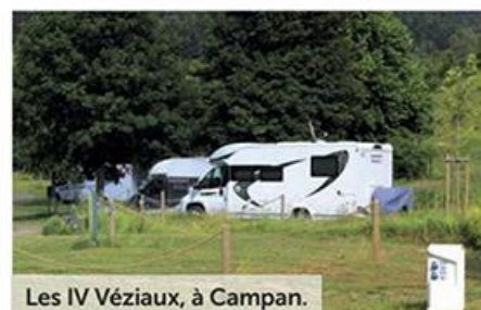
Les IV Véziaux, à Campan.