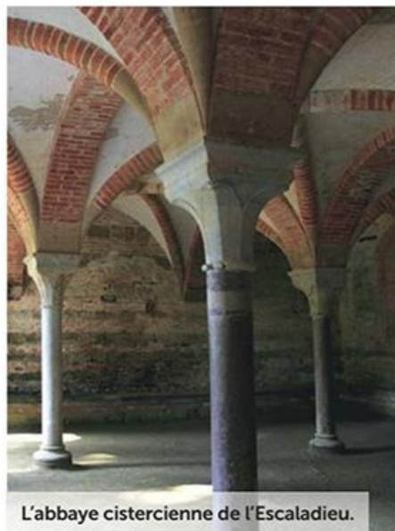
L'abbaye cistercienne de l'Escaladieu.