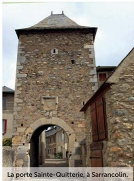
La porte Sainte-Quitterie, à Sarrancolin.

aussi pique-niquer, faire une éventuelle halte nocturne. Du pré, suivre un chemin de terre qui gravit la colline jusqu'à atteindre la porte des anciens remparts. Ça grimpe... pas longtemps. Quelques mètres encore et nous voilà au sommet de l'ancien château fort occupé par les Allemands lors de la dernière guerre mondiale. Les vestiges du donjon offrent une superbe vue sur les collines des Baronnie jusqu'aux hautes cimes des Pyrénées. Revenez à La Barthe et mettez le cap vers le sud, en direction d'Hèches. A l'entrée d'Izaux, gagnez les grottes de Labastide (stationnement nocturne autorisé sur le parking). Là, un diaporama met en valeur les concrétions de la grotte et vous entraîne dans un merveilleux voyage au cœur de la préhistoire. On y a découvert, en effet, des peintures représentant des chevaux et des bisons, mais aussi des bouquetins, des rennes et une tête de félin.