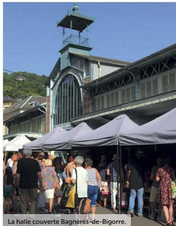
La halle couverte Bagnères-de-Bigorre.

« A partir d'un château médiéval ou d'un col, les panoramas sur les Baronnie pyrénéennes sont splendides et uniques »