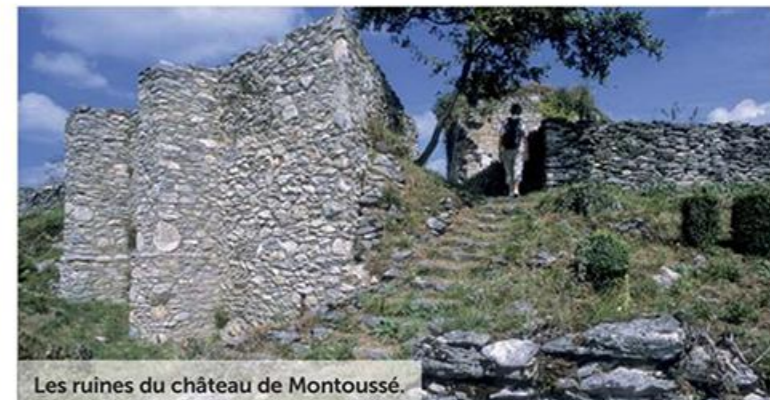
Les ruines du château de Montoussé.