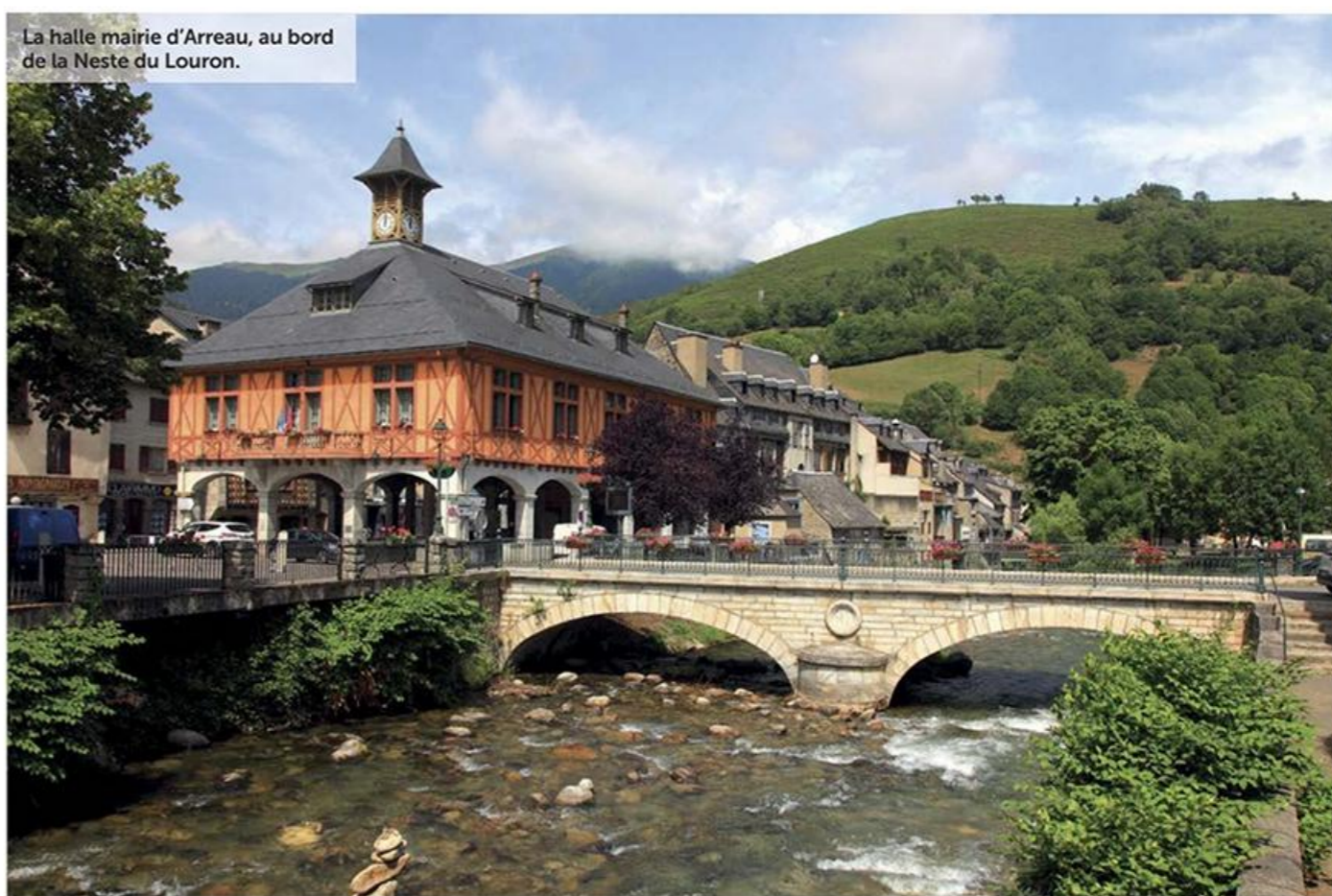
La halle mairie d'Arreau, au bord de la Neste du Louron.

De Labastide, prenez les D26G et D26 en direction d'Esparros. La route franchit le col de Coupé (730 m) avant d'atteindre le fameux gouffre d'Esparros –qui compte parmi les plus beaux sites souterrains de France, par la profusion de ses cristaux. Ce jardin minéral est aussi célèbre pour son lac et ses concrétions d'aragonites. Revenez dans la vallée d'Aure. En passant par le vieux bourg médiéval de Sarrancolin, gagnez Arreau situé à la confluence des vallées d'Aure et du Louron et de leurs rivières respectives. Ce village conserve un bel ensemble architectural, avec ses demeures anciennes telle la maison des Lys, sa halle mairie et son château qui abrite l'Office de Tourisme et le musée de Cagots. Grimpez ensuite au col d'Aspin, où un panorama grandiose vous attend. Sur l'autre versant, on plonge sur le lac de Payolle, entouré de splendides forêts de sapins : un environnement qui lui vaut le surnom de "petit Canada" et un lieu idéal pour des balades à pied ou à vélo. De là, on peut rejoindre Sainte-Marie-de-Campan et la vallée de Campan. A ce stade, si vous n'êtes jamais monté au pic du Midi de Bigorre, il ne faut pas hésiter une seconde pour se lancer dans cette ascension. Elle se fait sans effort, car il suffit d'emprunter le téléphérique qui vous mènera en quelques minutes sur les terrasses d'où une vue à 360° sur la chaîne des Pyrénées est somptueuse et unique.