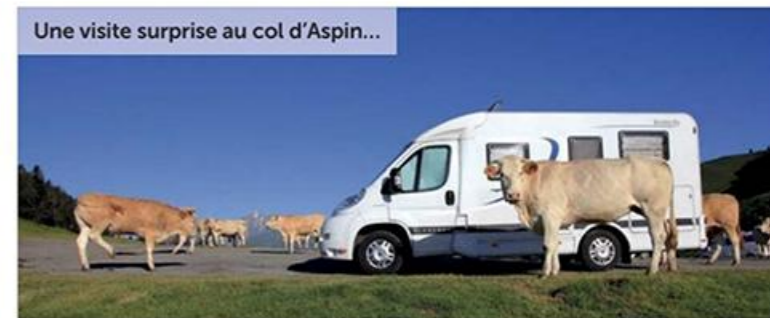
Une visite surprise au col d'Aspin...