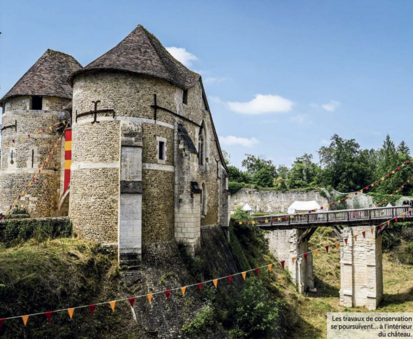
Les travaux de conservation se poursuivent... à l'intérieur du château.

Labellisé "Plus Beaux Villages de France", Le Bec-Hellouin dispose d'un camping avec des emplacements pour camping-cars et tous les services nécessaires. Infos : 02.32.44.83.55, www.campingsaintnicolas.fr