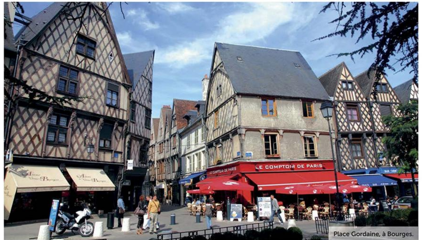
Place Gordaine, à Bourges.

Bourges est une étape obligatoire, avec en point d'orgue sa cathédrale Saint-Etienne, classée au Patrimoine mondial de l'Unesco. C'est l'une des plus vastes de France, exhibant des portails sculptés grandioses et un ensemble rare de vitraux du début du XIII e siècle. Si elle est ouverte, ne manquez pas d'accéder à sa tour. En récompense de ce petit effort, vous jouirez d'un magnifique panorama sur la vieille ville. Dans la cité médiévale, la place Gordaine montre d'imposantes maisons à pans de bois. Visitez le palais Jacques Cœur, argentier du roi de France, et les jardins des Prés Fichaux, aménagés dans l'entre-deux-guerres dans le style Art déco. Bourges réclame donc du temps, surtout si l'on se montre un peu curieux.