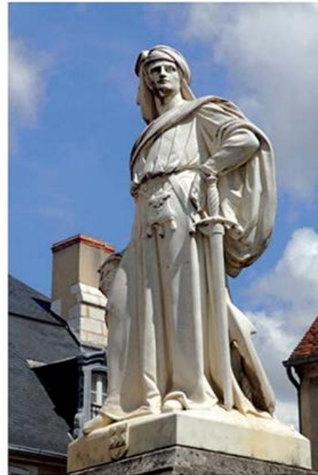
Jacques Cœur, célèbre statue de Bourges.

Cap au sud pour rejoindre Jalognes et son château de Pesselières qui n'est, hélas, pas ouvert à la visite. C'est donc son parc romantique qui vous retiendra un moment. En direction d'Henrichemont, on passe forcément par La Borne, très ancien village de potiers (XIII e siècle) toujours en activité. Outre quelques ateliers dans le bourg et ses alentours ainsi qu'un musée de la Poterie, on peut y découvrir son Centre céramique contemporaine.