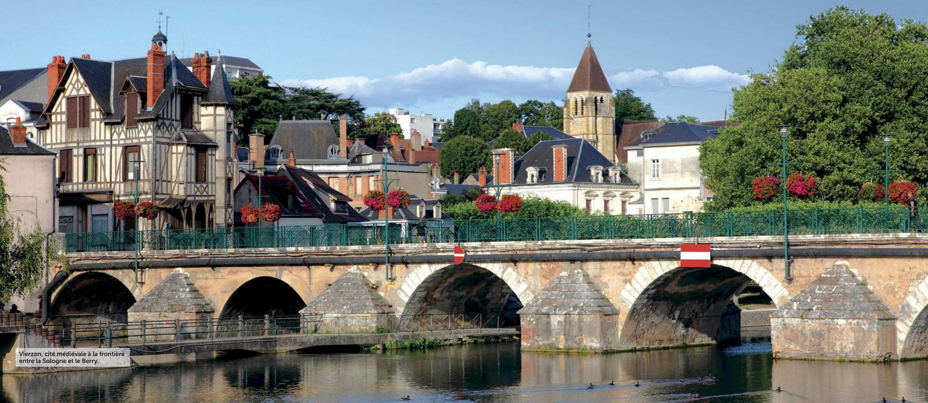
Vierzon, cité médiévale à la frontière entre la Sologne et le Berry.