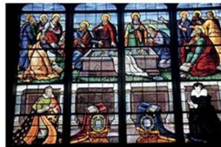
Cathédrale Saint-Etienne de Bourges.

A La Chapelle-d'Angillon, une halte s'impose pour visiter son château. Cette forteresse érigée au XI e siècle, meublée et habitée, abrite un modeste musée consacré à Alain-Fournier, l'auteur du Grand Meaulnes , natif de la commune. On se trouve désormais aux portes de la Sologne berrichonne, dont Aubigny-sur-Nère est la capitale. Une ville charmante et particulièrement animée le samedi matin par son grand marché qui se tient de l'église jusqu'au château des Stuarts.