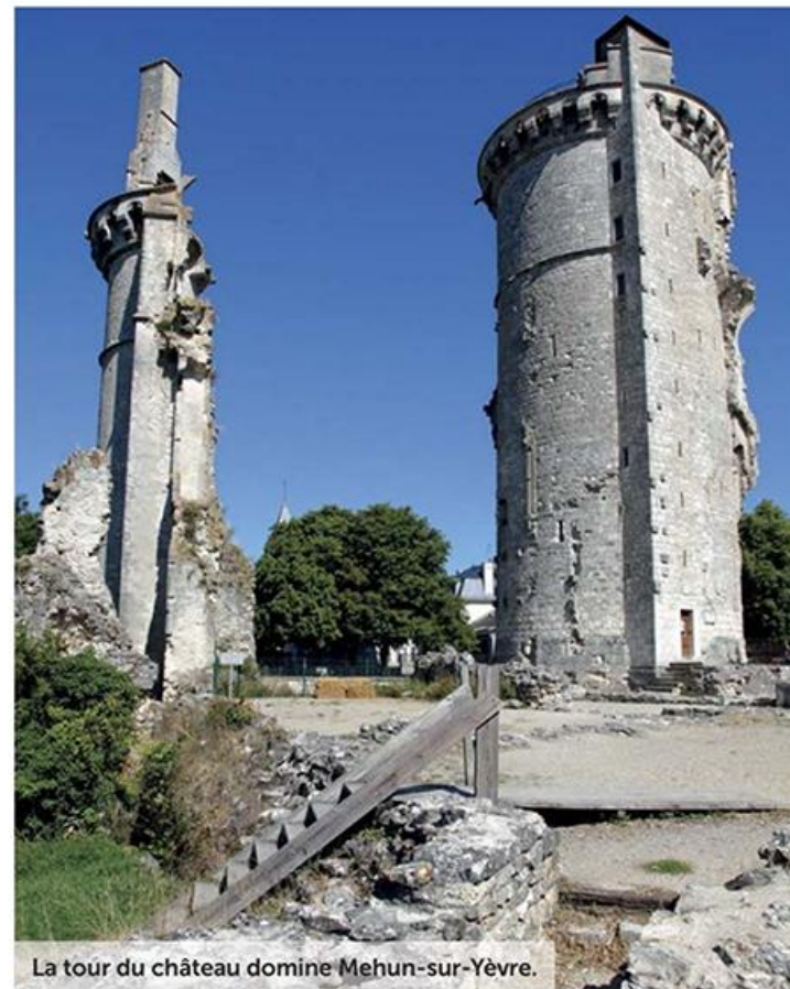
La tour du château domine Mehun-sur-Yèvre.

Plus au sud, près de Saint-Amand-Montrond, qui revendique aussi, le titre de centre de la France, deux sites sont à découvrir absolument. L'abbaye cistercienne de Noirlac construite à partir de 1150 et superbement restaurée. C'est une des abbayes les mieux conservées de l'Hexagone. On y visite l'église très épurée, le cloître de style gothique, la salle capitulaire, les dortoirs des moines, le réfectoire... En se rapprochant de l'Allier, le château d'Ainay-le-Vieil compte aussi au nombre des sites incontournables. Cet édifice du XIII e siècle avec ses tours, douves en eau, corps de garde, chemin de ronde, s'est enrichi au fil du temps d'un logis Renaissance de toute beauté. Il est habité par la même famille depuis des siècles. On complétera la visite par une excursion dans le parc et les jardins classés Jardins remarquables.