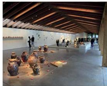
Centre céramique contemporaine (La Borne).

Ce ne sont pas les manoirs et autres palais qui manquent dans cette région, comme le château de Blancafort, édifié au XV e siècle et entouré de remarquables jardins, ou encore celui de la Verrerie, au sud d'Oizon, un petit joyau Renaissance.