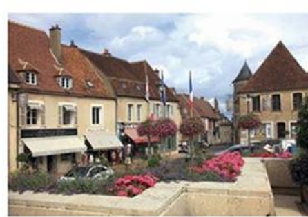
Place du marché, à Sancerre.

D ominant la vallée de la Loire, Sancerre est l'une des plus belles portes d'entrée du Berry. Son vignoble a fait sa réputation avec ses vins blancs, aromatiques et secs comme le calcaire et le silex des collines, ses rouges et ses rosés issus du cépage de pinot noir*. Mais c'est aussi un village médiéval, perché au-dessus du fleuve royal et jadis ceinturé de remparts. Ses ruelles tortueuses, étroites et souvent en pente, ont séduit les visiteurs qui l'ont élu "Village préféré des Français" en 2021. Ne manquez pas de passer par la maison des Sancerre, qui vous fera découvrir les prestigieux vins, et offre depuis sa terrasse une vue imprenable sur le vignoble.