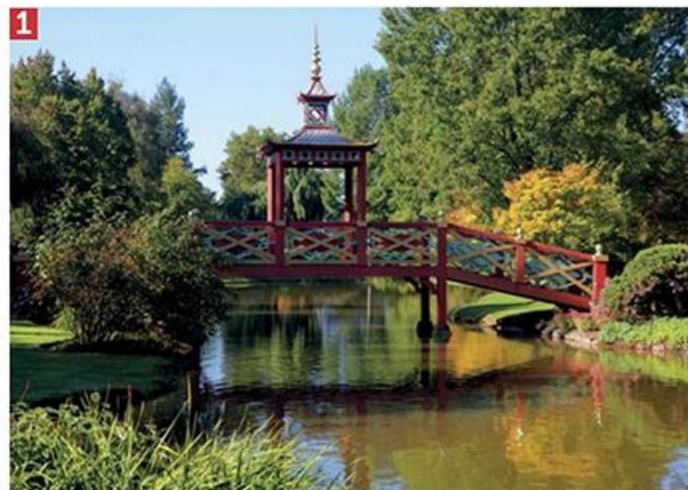
Parc Florac d'Apremont-sur-Allier.

productions issues des différentes manufactures de porcelaine (la ville en a compté une dizaine au début du XX e siècle), d'admirer les objets en grès flammés Denbac et les pièces en verre.