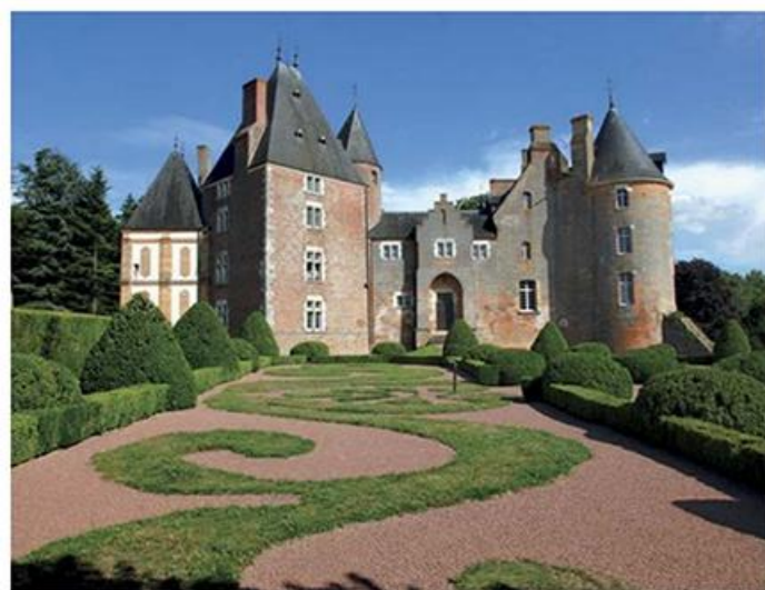
Château de Blancafort et son jardin à la française.

Office de Tourisme de Bourges (18) Place Simone-Veil Infos : 02.48.23.02.60, www.berryprovince.com