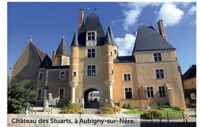
Château des Stuarts, à Aubigny-sur-Nère.

Pour finir, il faut revenir vers l'est via Sancoins pour découvrir Apremont-sur-Allier. Ce village, d'une parfaite homogénéité, s'étire sous un gros château qui ne se visite pas. Son parc floral, en revanche, constitue une halte d'un charme absolu.