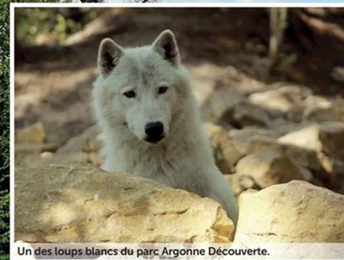
Un des loups blancs du parc Argonne Découverte.