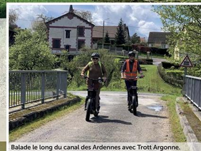
Balade le long du canal des Ardennes avec Trott Argonne.

A mi-chemin entre Reims et Charleville-Mézière, Rethel est le point de départ de notre balade. La ville, qui a subi les affres de la Révolution française et des conflits mondiaux (incendie durant les deux dernières guerres, elle fut détruite à 80 %), est aujourd'hui une petite commune moderne et dynamique qui borde l'Aisne et le canal des Ardennes. De la vieille ville, reste toutefois l'église Saint-Nicolas