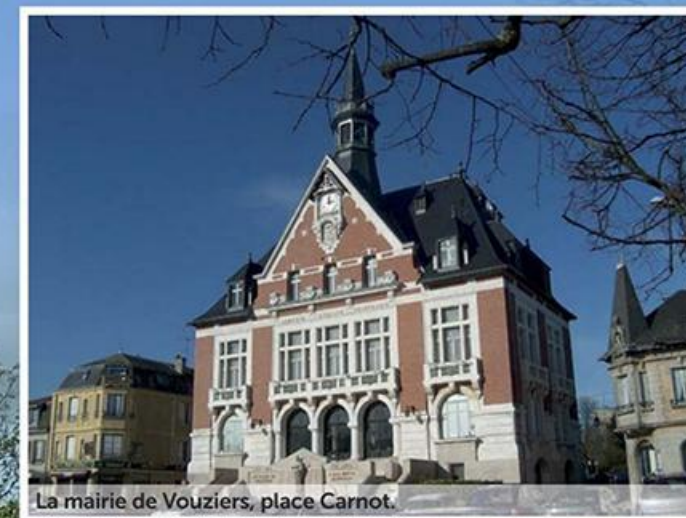
La mairie de Vouziers, place Carnot.